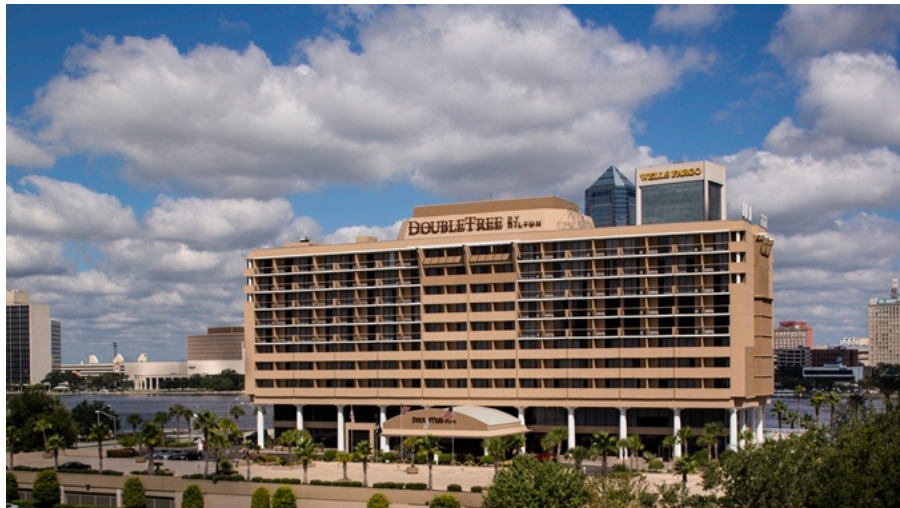
Het DoubleTree by Hilton Jacksonville Riverfront

De 2018 DDG-5 crew members Association reünie zeilde over de horizon op zondag 6 mei 2018. Het was geweldige tijd met veel kameraadschap onder Shipmates en hun vrouwen. Net als in 2016, het DoubleTree by Hilton Jacksonville Riverfront was onze gastheer Hotel en wederom het hotel en het personeel waren uitzonderlijk.